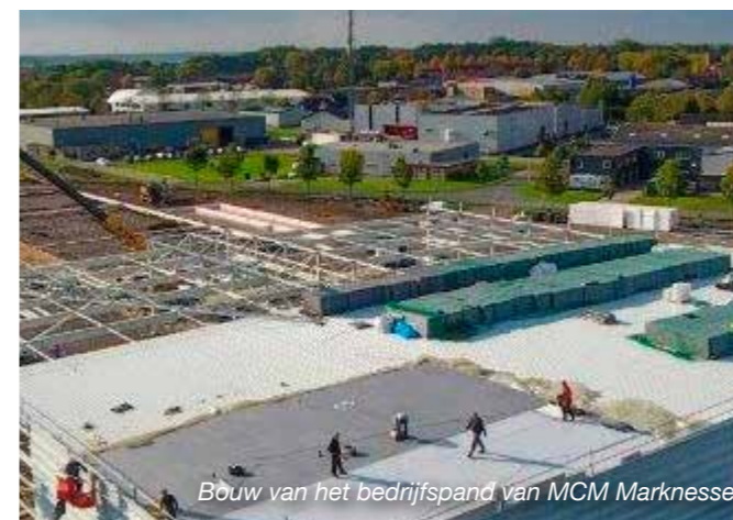
Bouw van het bedrijfspand van MCM Marknesse

Een persoonlijke favoriet is de opdracht die via theaterproducent Joop van den Ende op het bord van Bakker Workum terecht kwam. In 2010 vervaardigde het bedrijf de volledige staalconstructie van theater DeLaMar in Amsterdam. De liftschachten werden met glas bekleed en later werd de klus uitgebreid met de levering en montage van de stalen trappen met glasbalustraden. "Uiteindelijk hebben we zo'n 450 ton staal naar hartje Amsterdam gebracht", kijkt Ekkelboom terug. "De grootste uitdaging