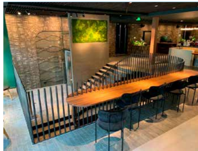
Met Hotel in Amsterdam