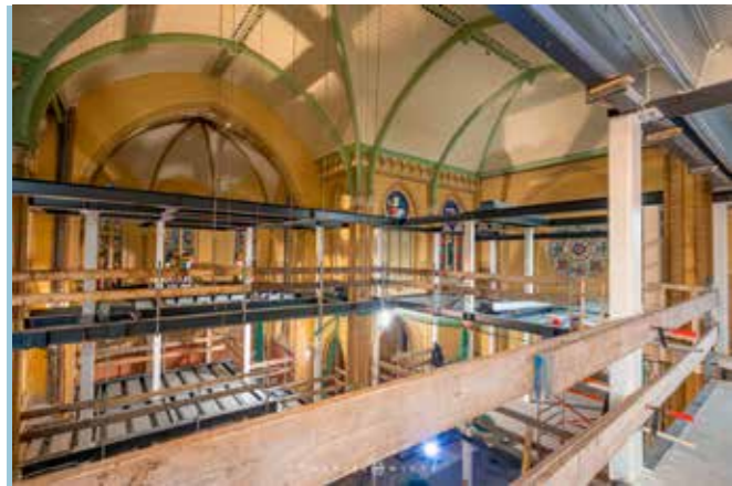
Montage-werkzaamheden Joseph kerk in Alkmaar

Voor een bedrijfsloods in Harlingen, een opslag van 120x40 meter, produceerde en monteerde Bakker in 2022 de staalconstructie. Ook werden de betonnen borstweringselementen geplaatst.