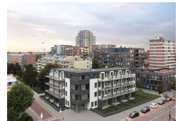
Verbouwing kantoorgebouw Zonnehuys Beverwijk

In Beverwijk werkte Bakker Workum mee aan de verbouwing van een kantoorgebouw naar 28 luxe appartementen. Het gebouw is onlangs opgeleverd en het Friese bedrijf maakte onder meer de staalconstructies voor de nieuwe balkons en galerijen.