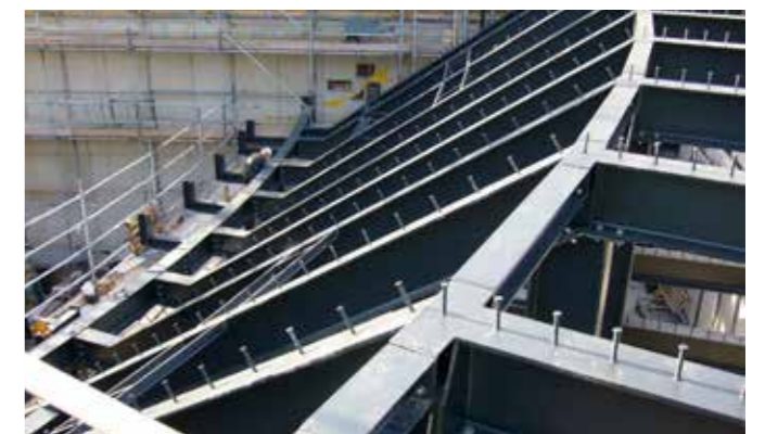
Volledige staalconstructie DeLaMar

"Wat dat betreft ziet het er voor 2023 eerst nog wel goed uit, al blijft het afwachten wat de markt gaat doen na de recente rentestijgingen en de problematiek omtrent de stikstof", zegt Ekkelboom, die evenwel positief is gestemd: "Want ook in Friesland en Groningen hebben we nog een aantal bijzondere werken in opdracht."