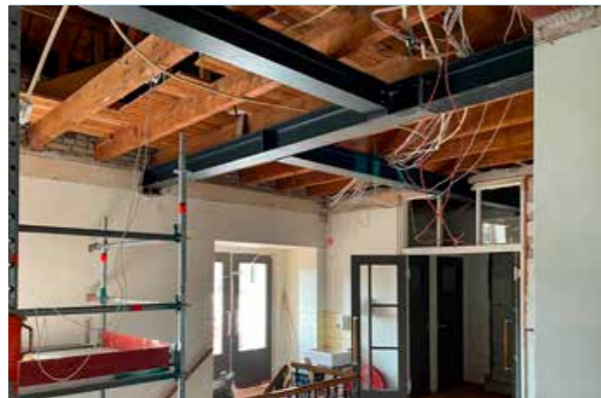
Zolderconstructie basisschool Bussum

In Bussum hielp Bakker mee aan de renovatie van een basisschool. Het bedrijf versterkte de zolderconstructie en